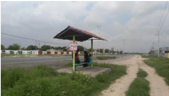
PB 6A Parabús con tubos de acero y banca metálica plataforma de concreto en malas condiciones, sin ciclovía. Terreno natural/maleza