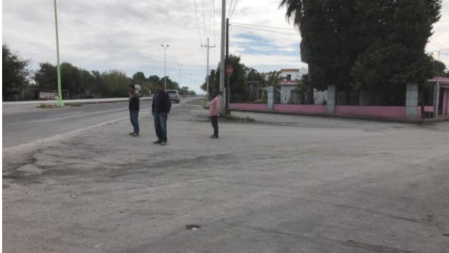
PB 11A Asfalto. Sin Parabús ni ciclovía