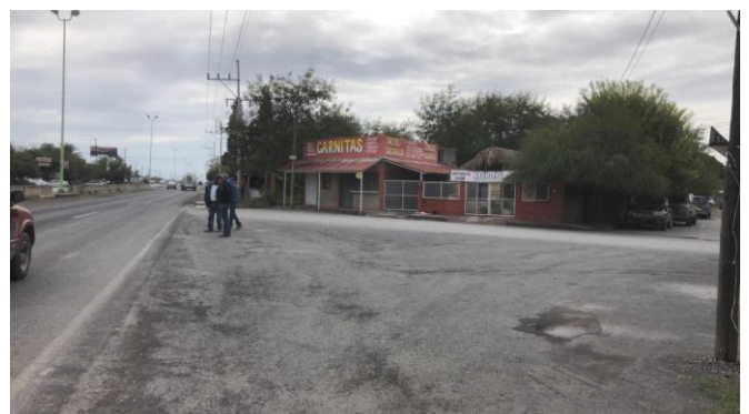
PB 10B Asfalto, sin ciclovía ni Parabús.

Km 6+087 Sur-Norte Ejido Ocho de Enero, Frontera