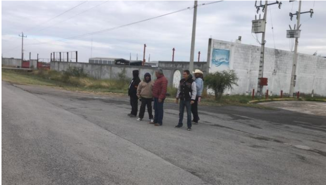
PB 3A Terracería/maleza, sin Parabús, sin ciclovía ni señalización.