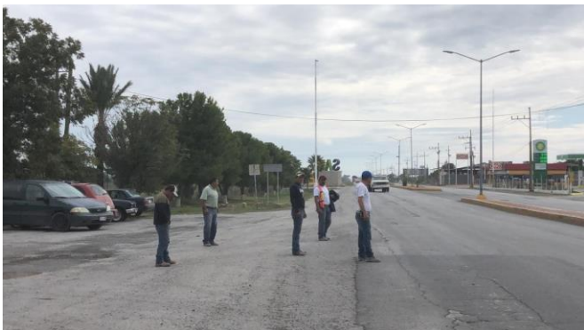
PB 14A Terracería, sin Parabús ni ciclovía.