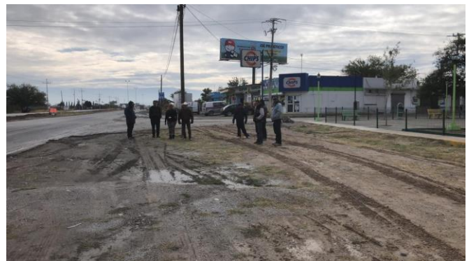
PB 6B Terracería. No cuenta con Parabús, sin ciclovía ni señalización.