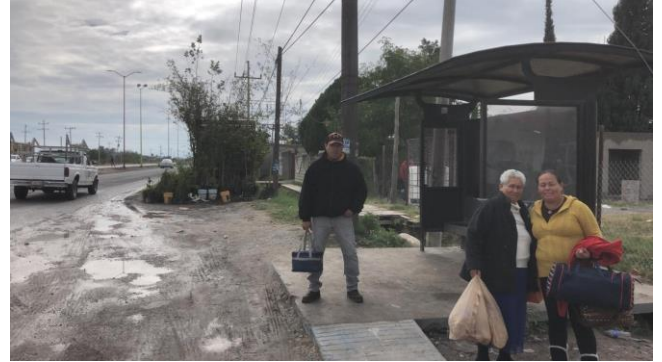
PB 9B Parabús con estructura metálica, sin ciclovía, ni banqueta. Superficie de concreto

Km 5+730 Sur-Norte Ejido Ocho de Enero, Frontera