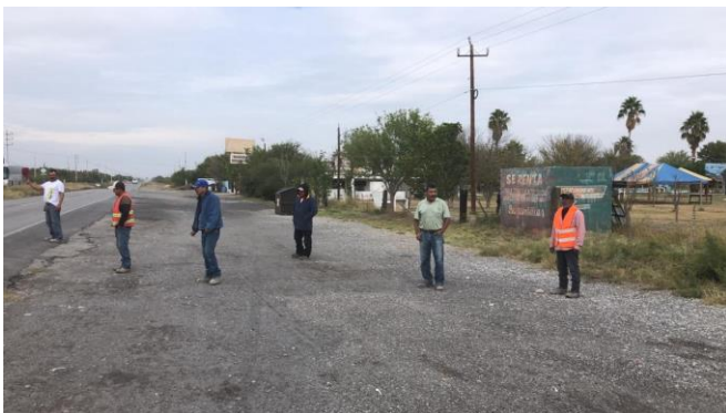
PB 12A Terracería/maleza, sin Parabús ni ciclovía.

Km 6+510 Norte-Sur Ejido Ocho de Enero, Frontera