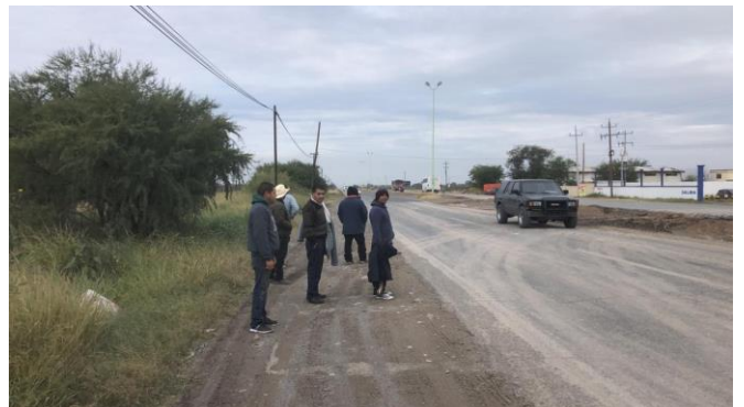
PB 4B Terracería/maleza sin Parabús, sin ciclovía ni señalización.