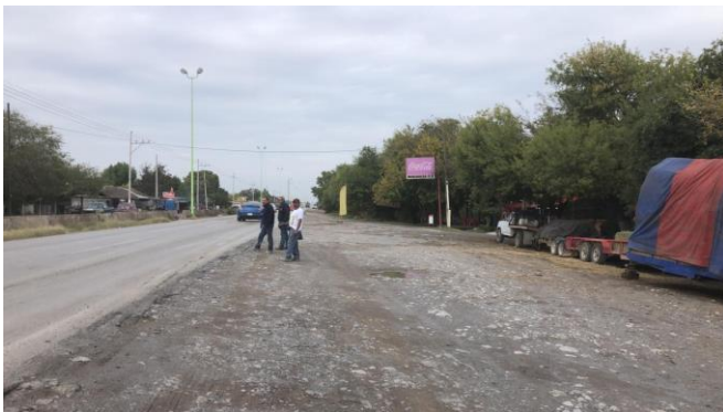
PB 10A Superficie de terreno natural. Sin Parabús ni ciclovía

Km 5+810 Norte-Sur Ejido Ocho de Enero, Frontera