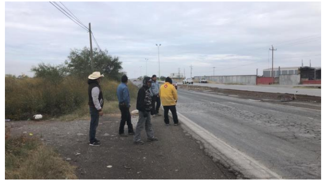
PB 3B Terrecería sin Parabús, sin señalética, sin ciclovía.