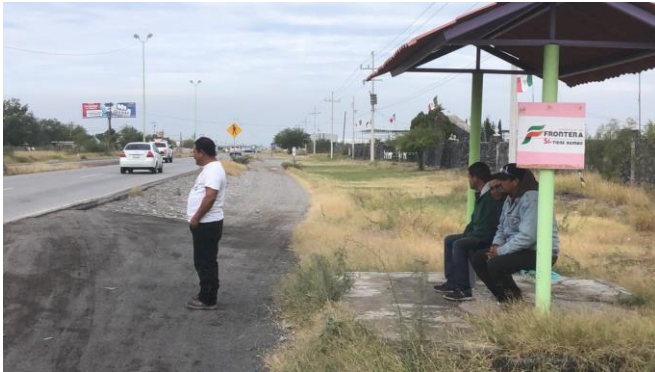
PB 5A Parabús con tubos de acero y banca metálica en malas condiciones, sin ciclovía. Terracería/maleza