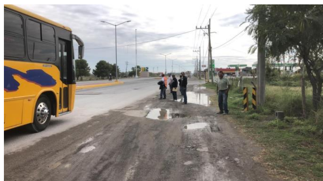
PB 14B Terracería/maleza, sin espacio suficiente para usuarios. Sin Parabús ni ciclovía