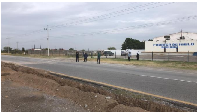
PB 8A Terracería/maleza. Sin Parabús, ni ciclovía.