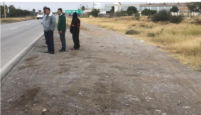
PB 2A Superficie de terracería sin Parabús ni ciclovia.