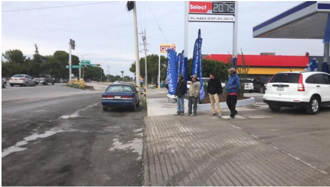
PB 15A Asfalto en malas condiciones, sin Parabús ni ciclo vía.