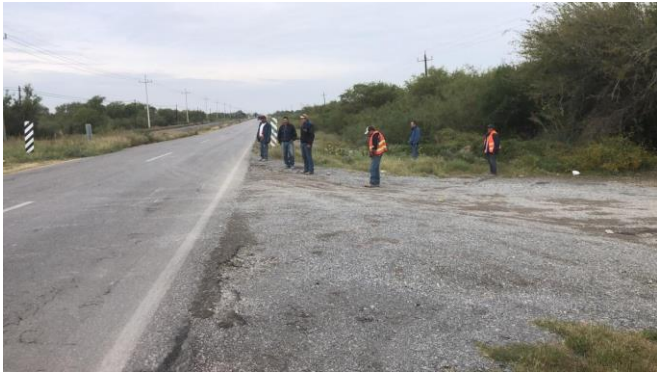
PB 13A Terracería/maleza, superficie irregular, sin espacio suficiente para usuarios. Sin Parabús ni ciclovía