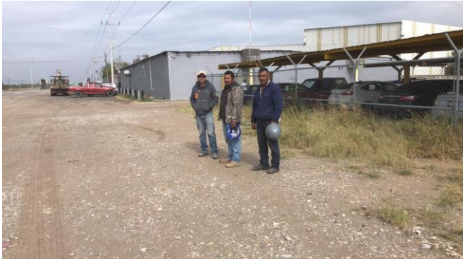
PB 7A Terracería, sin Parabús ni ciclovía.