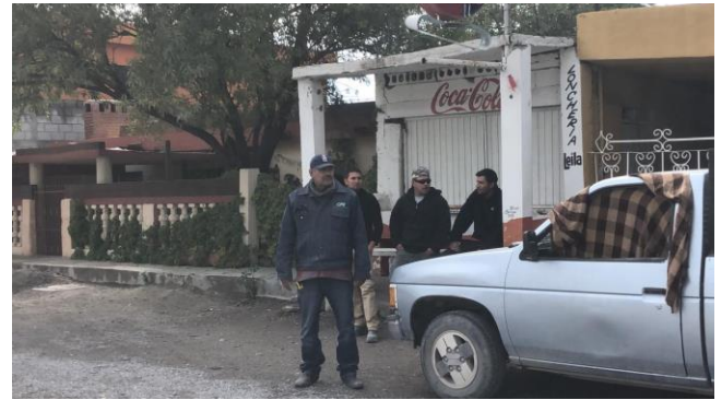
PB 15B Terracería. sin Parabús ni ciclo vía.