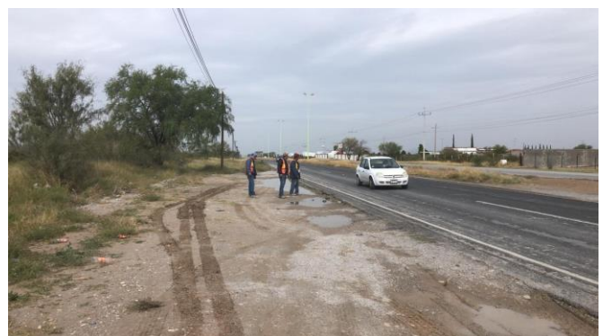
PB 8B Terracería/maleza. Sin ciclovía, sin Parabús. Superficie de terreno irregular