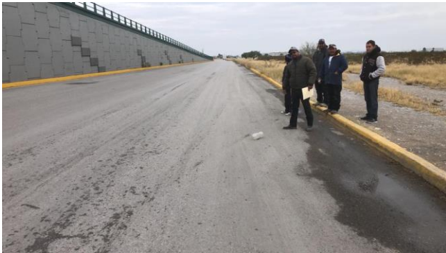
PB 1A Superficie de terracería/maleza, sin Parabús ni ciclovia.