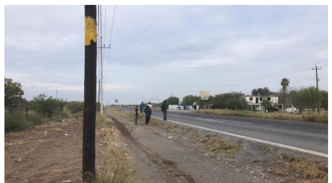
PB 12B Terracería/maleza, superficie irregular, sin espacio suficiente para usuarios. Sin Parabús ni ciclovía