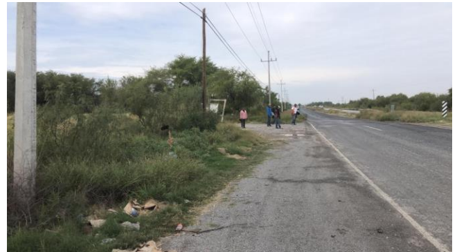
PB 13B Maleza, sin Parabús ni ciclovía