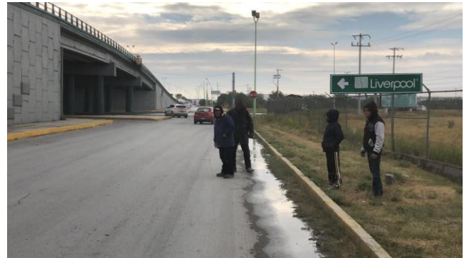
PB 1B Superficie maleza, sin Parabús ni ciclovia.