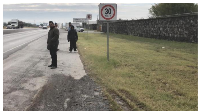
PB 2B Terracería con maleza sin Parabús ni ciclovia.