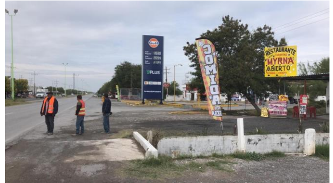
PB 11B Terreno natural. Sin ciclovía ni parabús

Km 6+495 Sur-Norte Ejido Ocho de Enero, Frontera