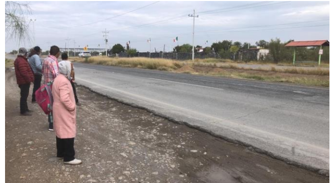
PB 5B Terreno natural/maleza. Sin ciclovía, ni Parabús.