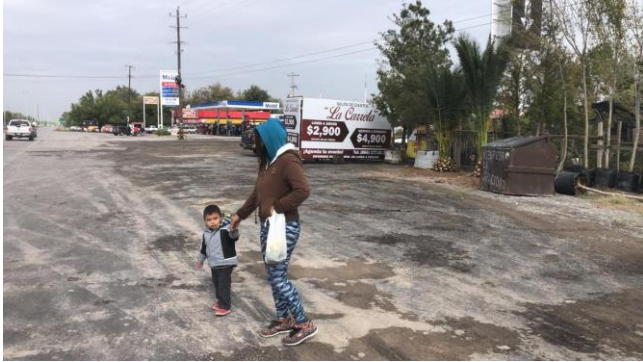
PB 9A Asfalto. No se cuenta con ciclovía ni Parabús.

Km 5+730 Sur-Norte Ejido Ocho de Enero, Frontera