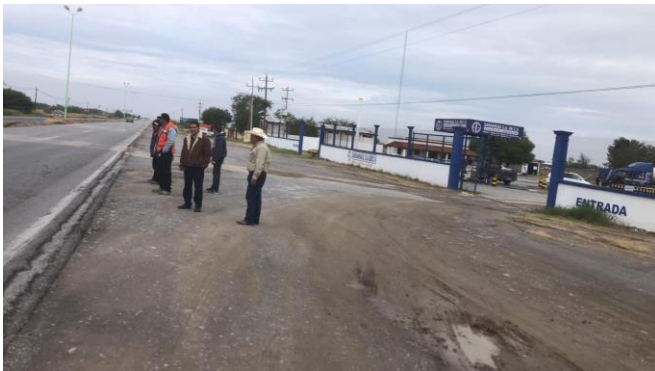
PB 4A Terracería sin Parabús ni ciclovía.