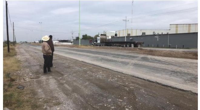
PB 7B Terracería/maleza, sin Parabús ni ciclovía